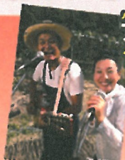
アイモコの 音楽農園