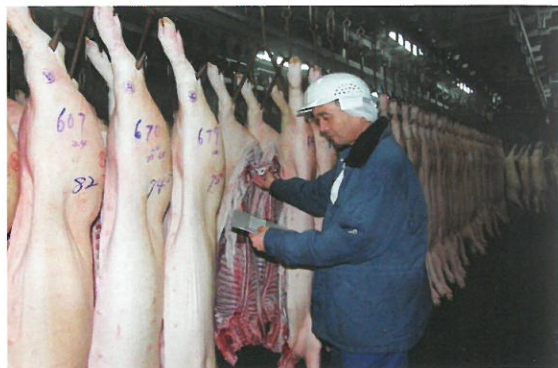
検査に合格した枝肉のみに検印が押され、食用として出荷される。

「適正に定められた品質をクリアし認定された豚肉にのみ証明書が交付され、商品には認定シールが添付されているので、購入や注文の際の目安にもなります。また、沖縄県アグーブランド豚推進協議会事務局のホームページでは、生